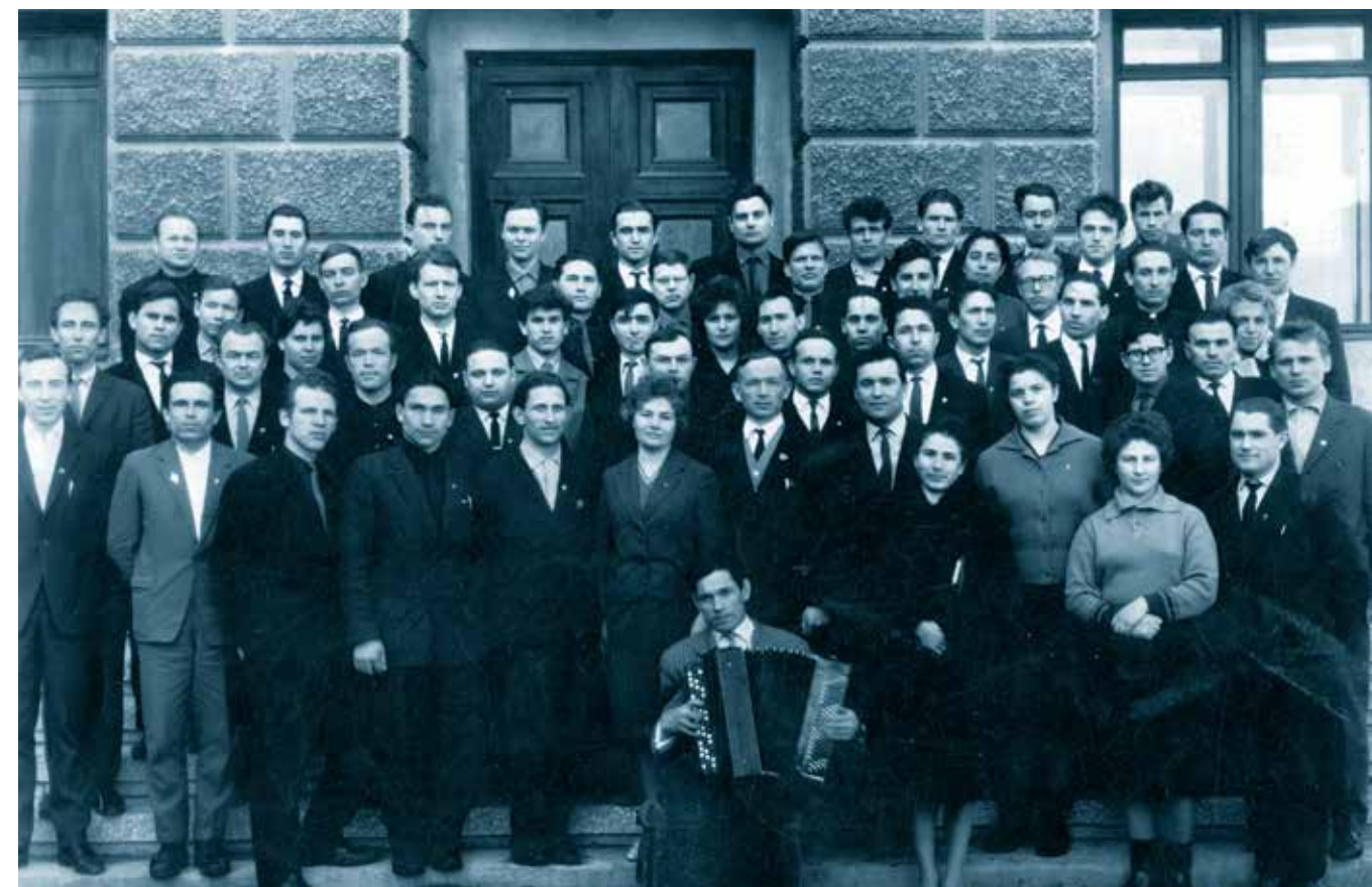
Участники семинара 1-х секретарей РК, ГК ВЛКСМ Чувашии и Мордовии. 1966 г.