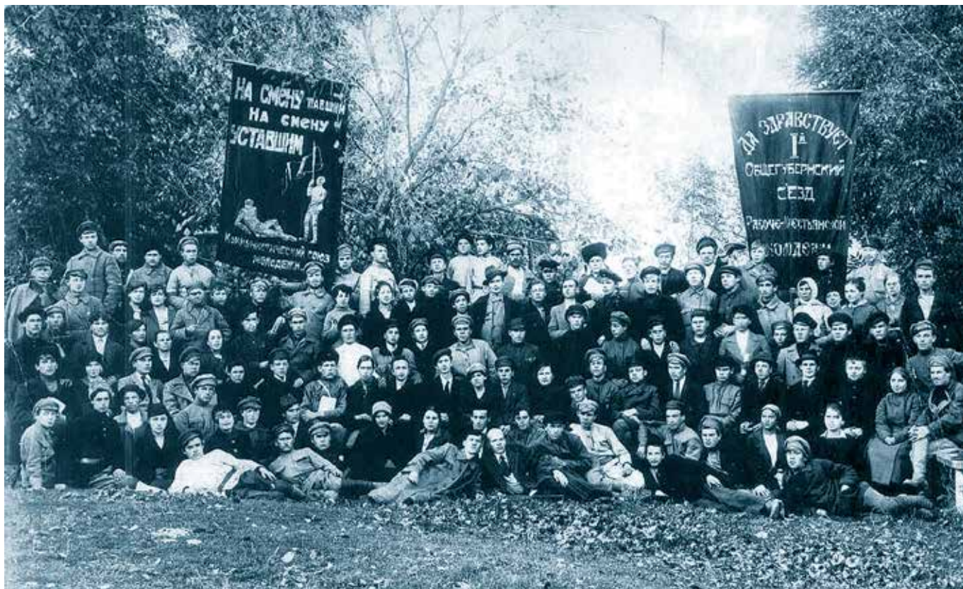
Делегаты I Пензенского губернского съезда рабоче-крестьянской молодежи. 1919 год