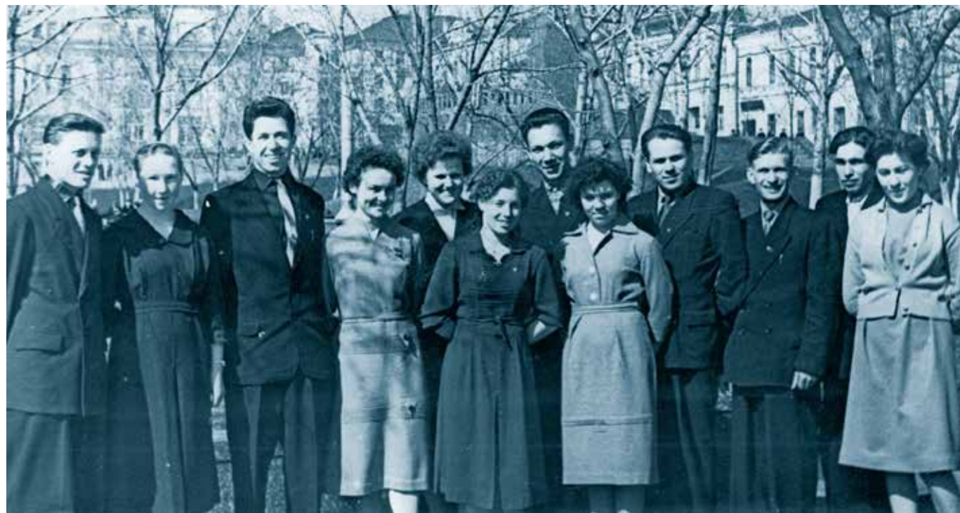
Делегаты от Мордовской АССР на XVI съезд ВЛКСМ. 1962 г.