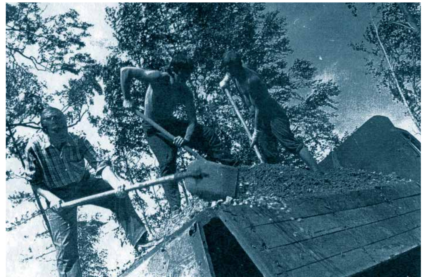
Комсомольцы на строительстве санатория «Сивинь»