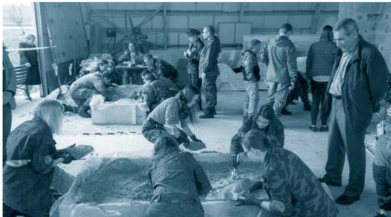
Поисковое движение Мордовии. Конкурс «Лучший поисковик года»