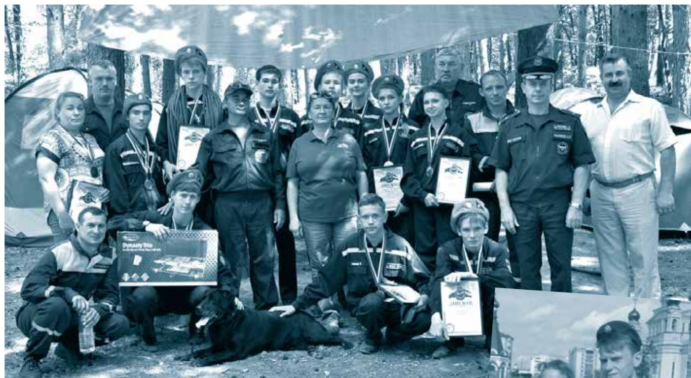
Члены клуба «Юный патриот» СОШ № 8, победившие в соревнованиях МЧС