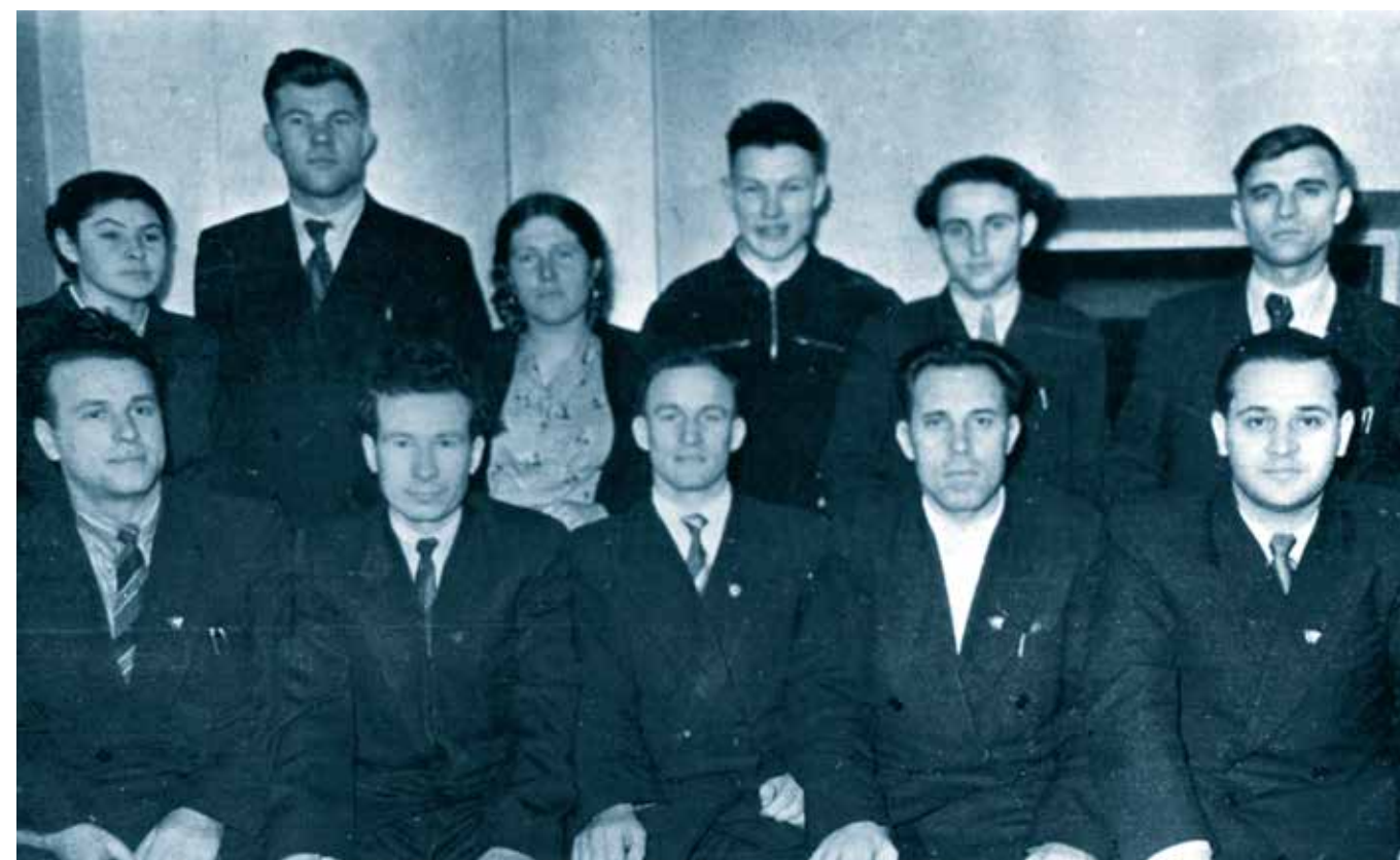
Делегация Атяшевской районной комсомольской организации на Мордовской областной комсомольской конференции. 1958 г.