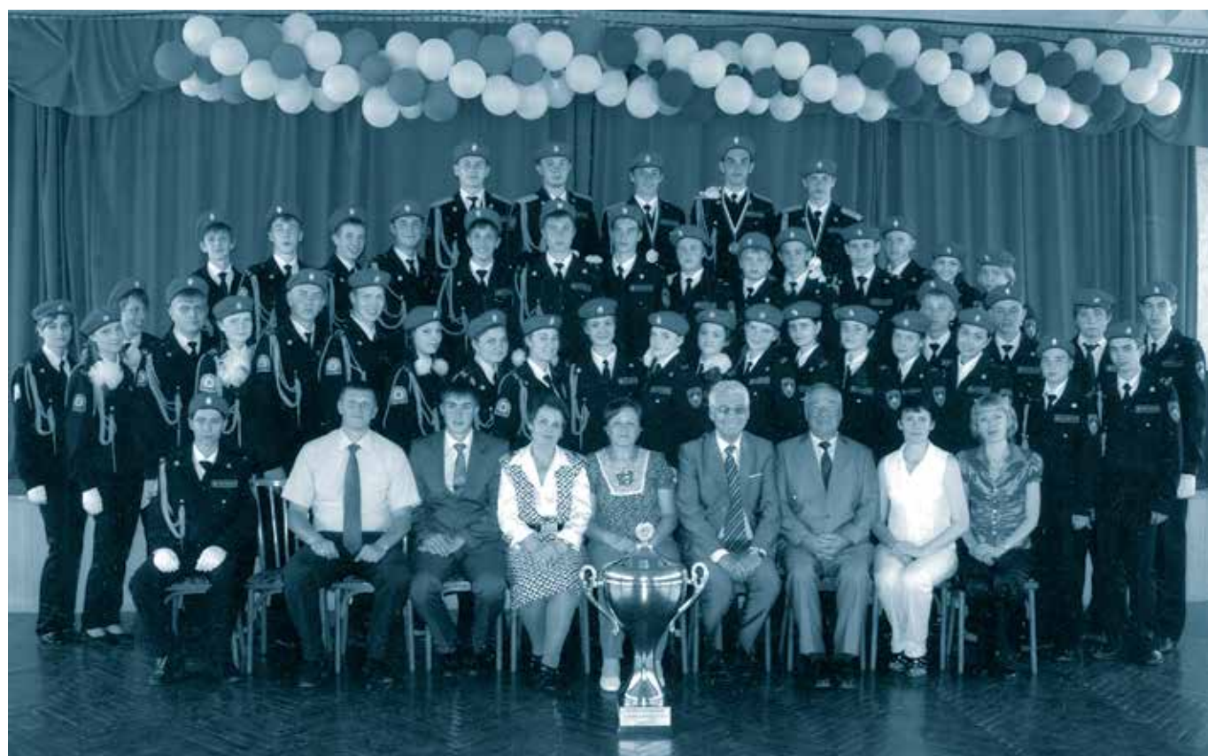
Кадеты МЧС. Лицей № 26