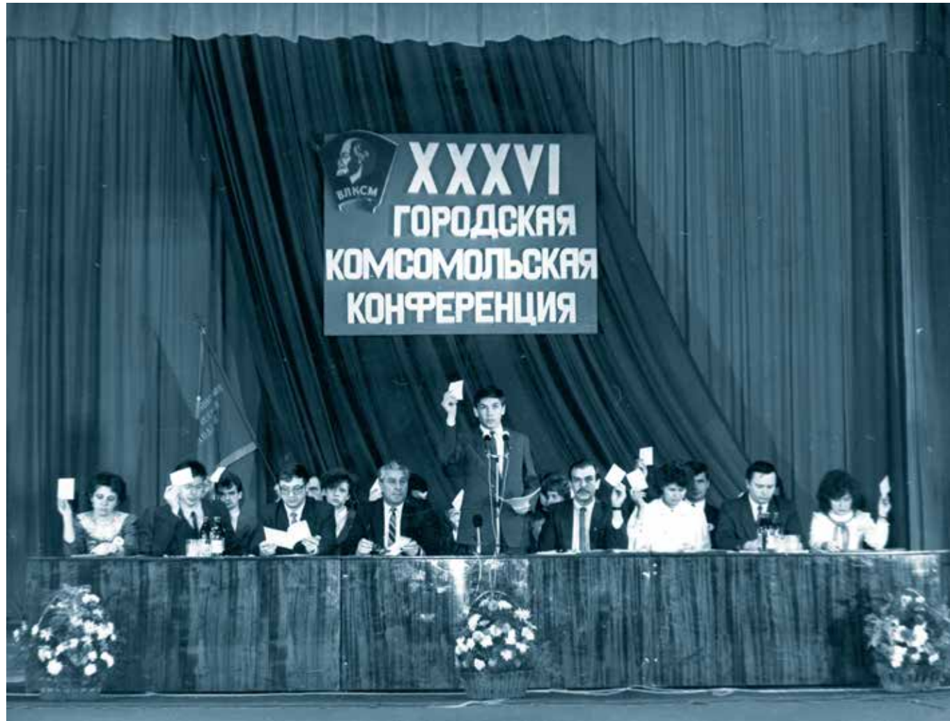
Президиум XXXVI Саранской городской комсомольской конференции. г. Саранск. 1989 г.