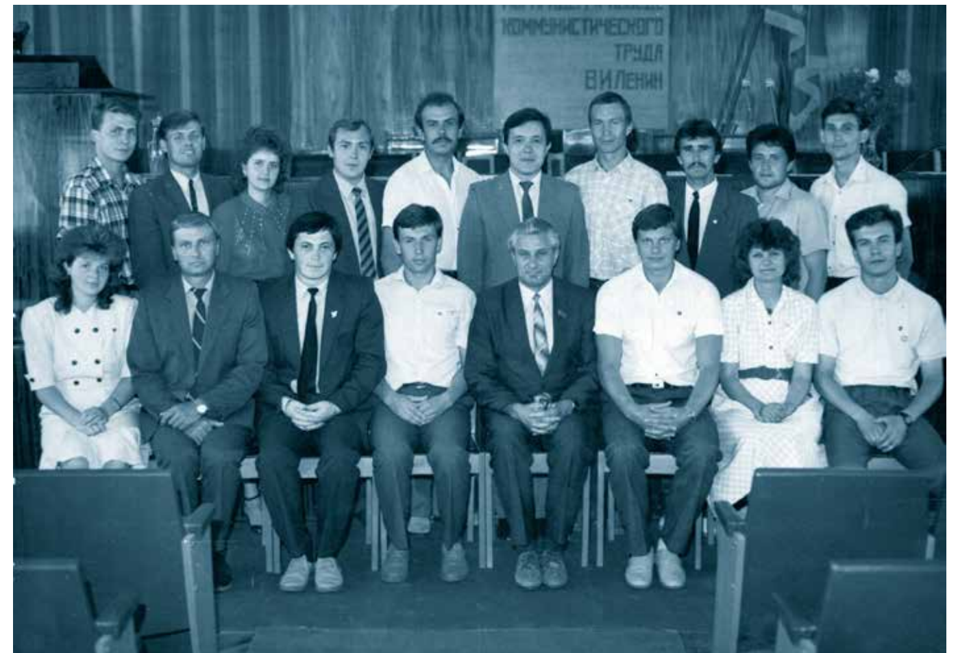
Группа участников VII организационного пленума Саранского городского комитета ВЛКСМ. 1989 г.