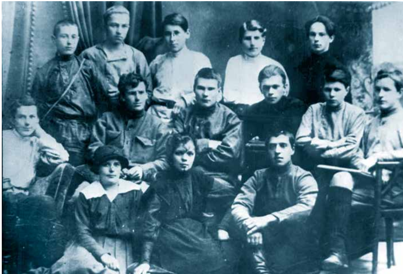
Саранский комсомольский актив. 1919 год