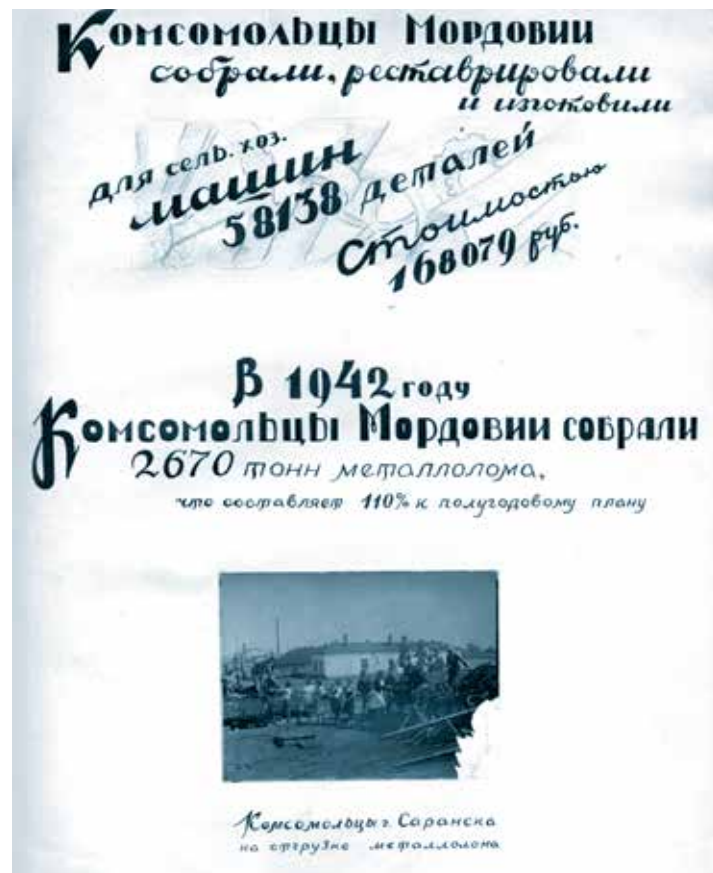
Из альбома фотографий «Комсомол Мордовии в Великой Отечественной войне»