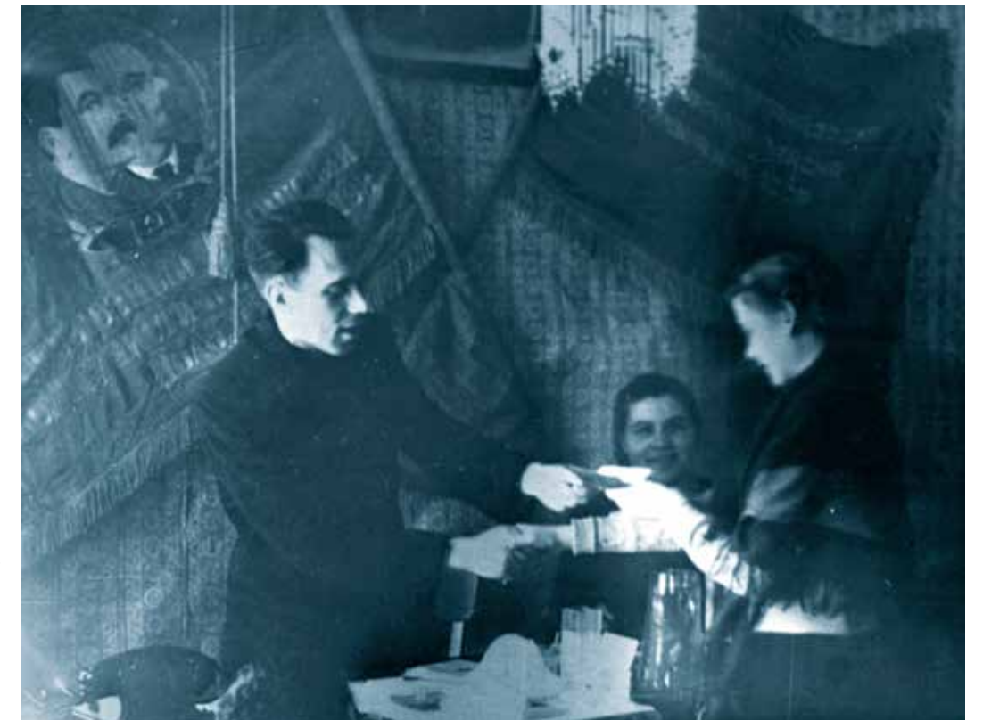
Обмен комсомольских документов в Атяшевском РК ВЛКСМ. 1956 г.