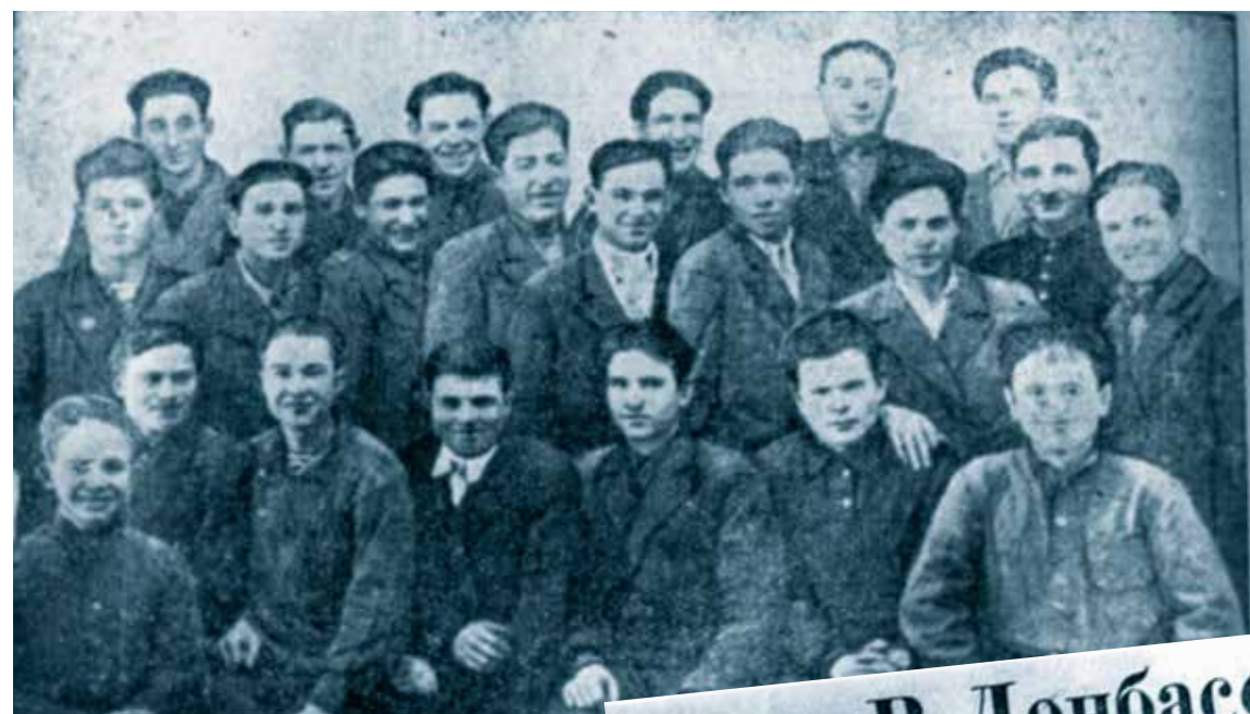
Комсомольцы и молодежь Инсарского района, изъявившие желание поехать на освоение целинных и залежных земель. 21 марта 1954 г.