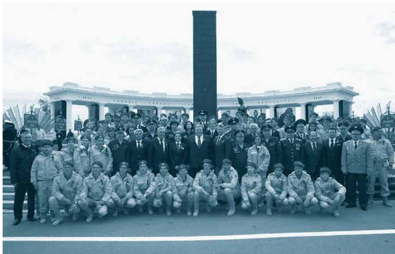
Встреча юнармейцев с Главой РМ В.Д. Волковым