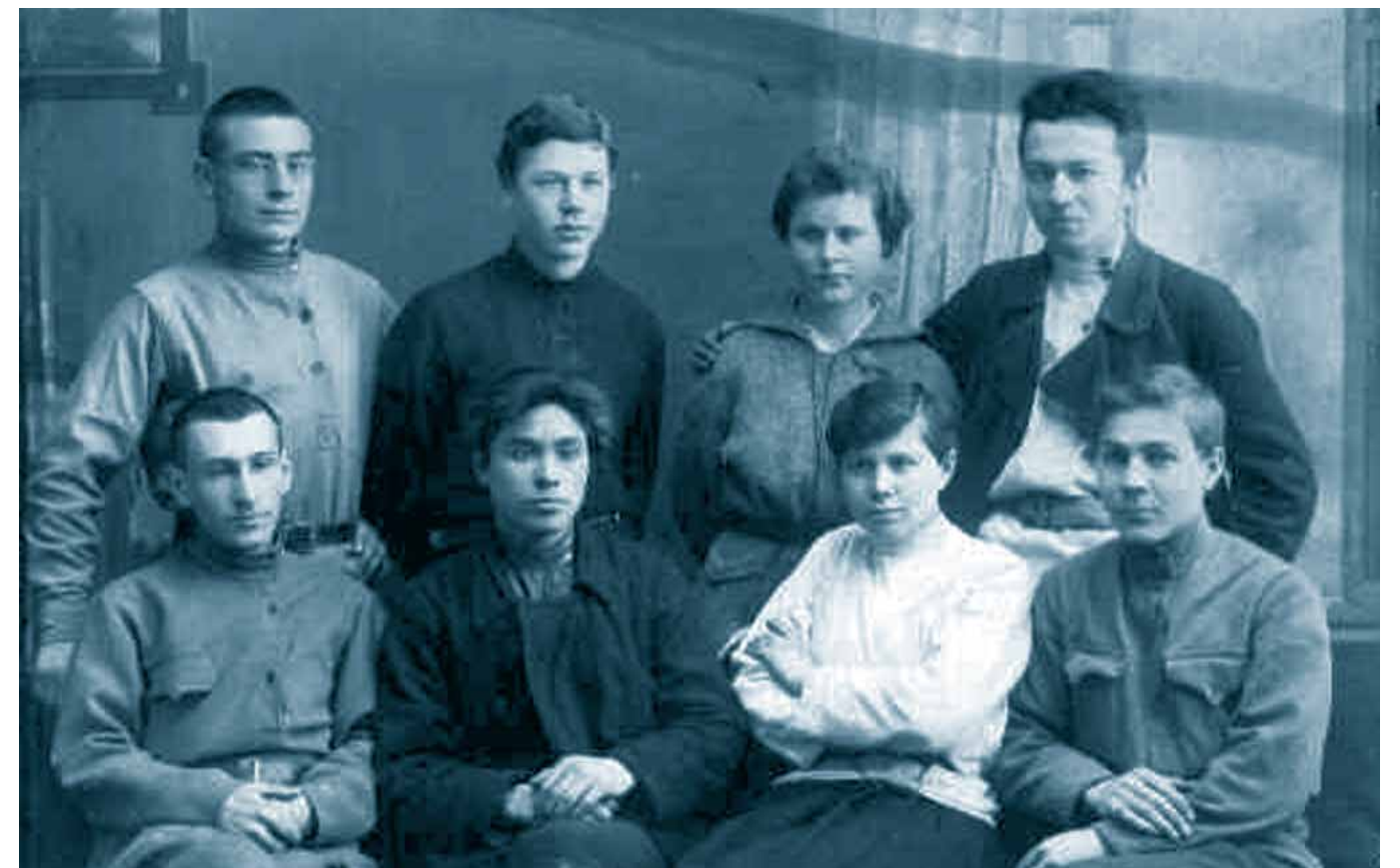
Члены Саранского уездного комитета РКСМ. 1919 год