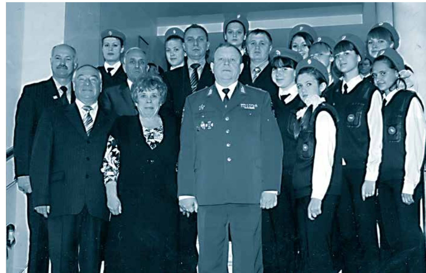
Кадеты-ушаковицы. СОШ № 3