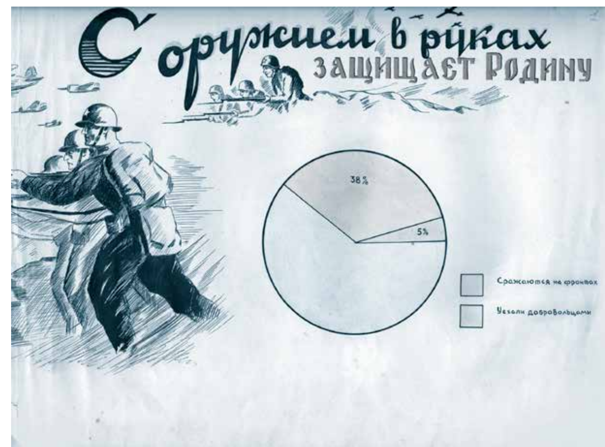
Из альбома фотографий «Комсомол Мордовии в Великой Отечественной войне»