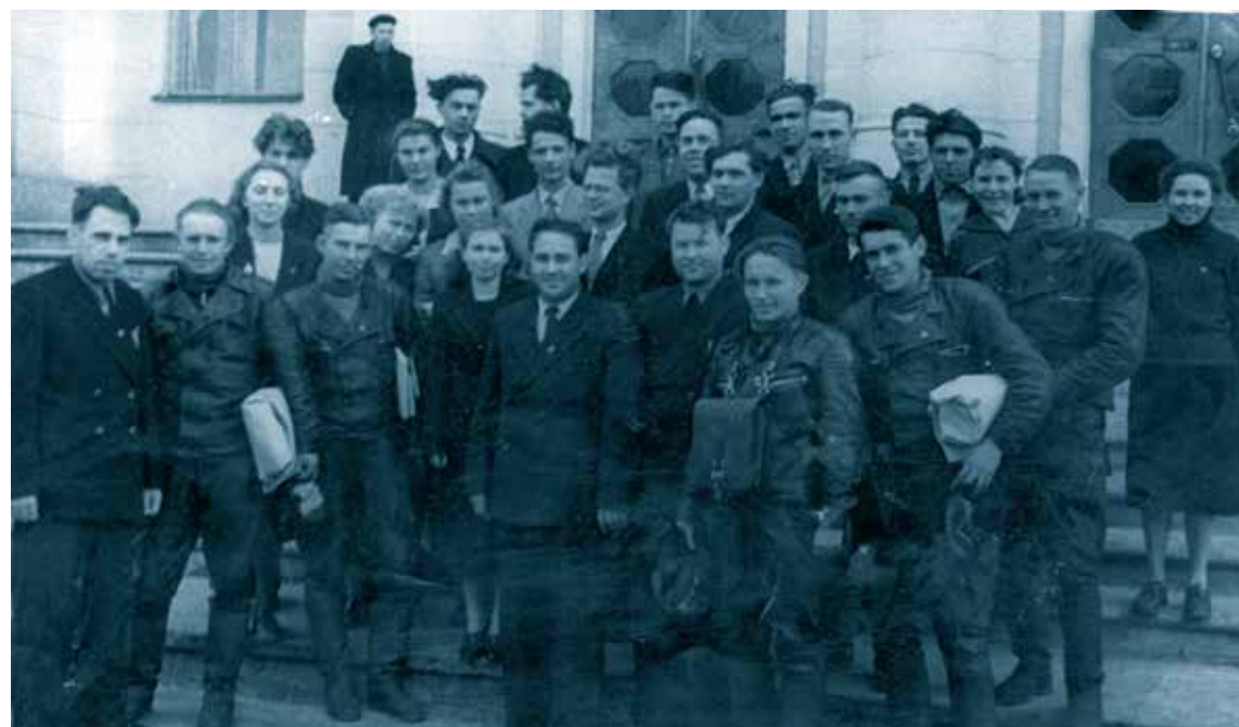
Работники Мордовского ОК ВЛКСМ с участниками мотоэстафеты, посвященной 40-летию ВЛКСМ. 1958 г.