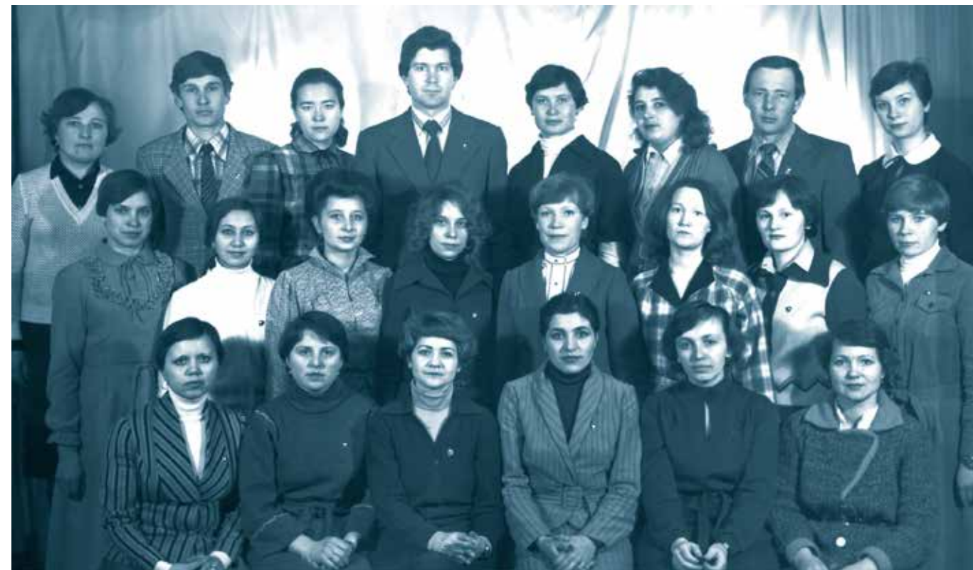
Секретари-заведующие отделами учащейся молодежи и пионеров горкомов и райкомов ВЛКСМ. Саранск, 1982 г.