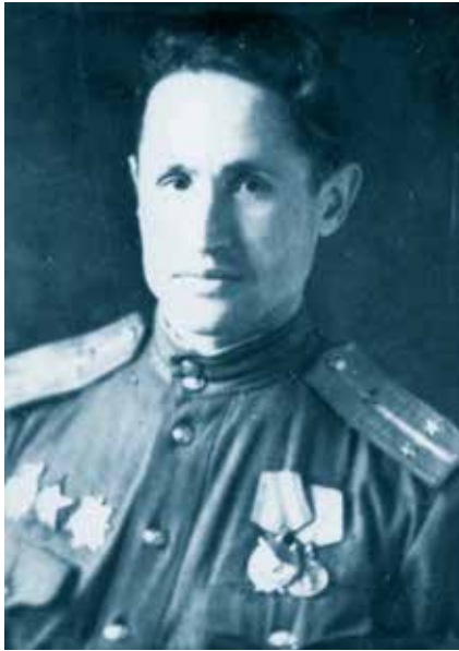
А.Н. Дерябин, Герой Советского Союза