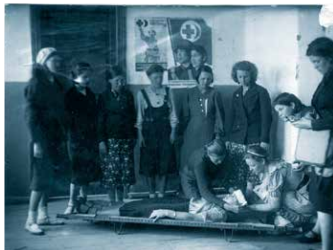
Группа сандружинниц школы № 9 г. Саранска на практических занятиях