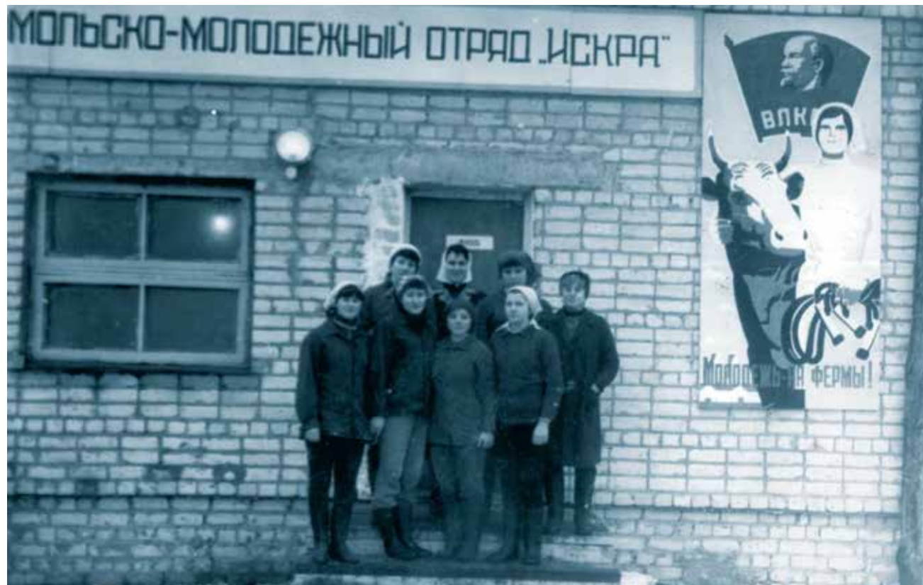
Комсомольско-молодежный отряд «Искра» у входа в коровник колхоза «Гигант». Ковылкинский район