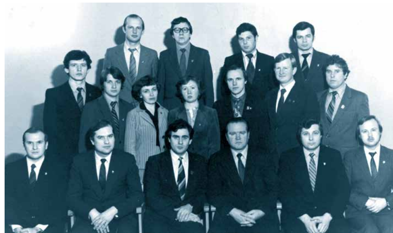
Руководящие работники Мордовского обкома, Саранского горкома, Ленинского и Пролетарского райкомов