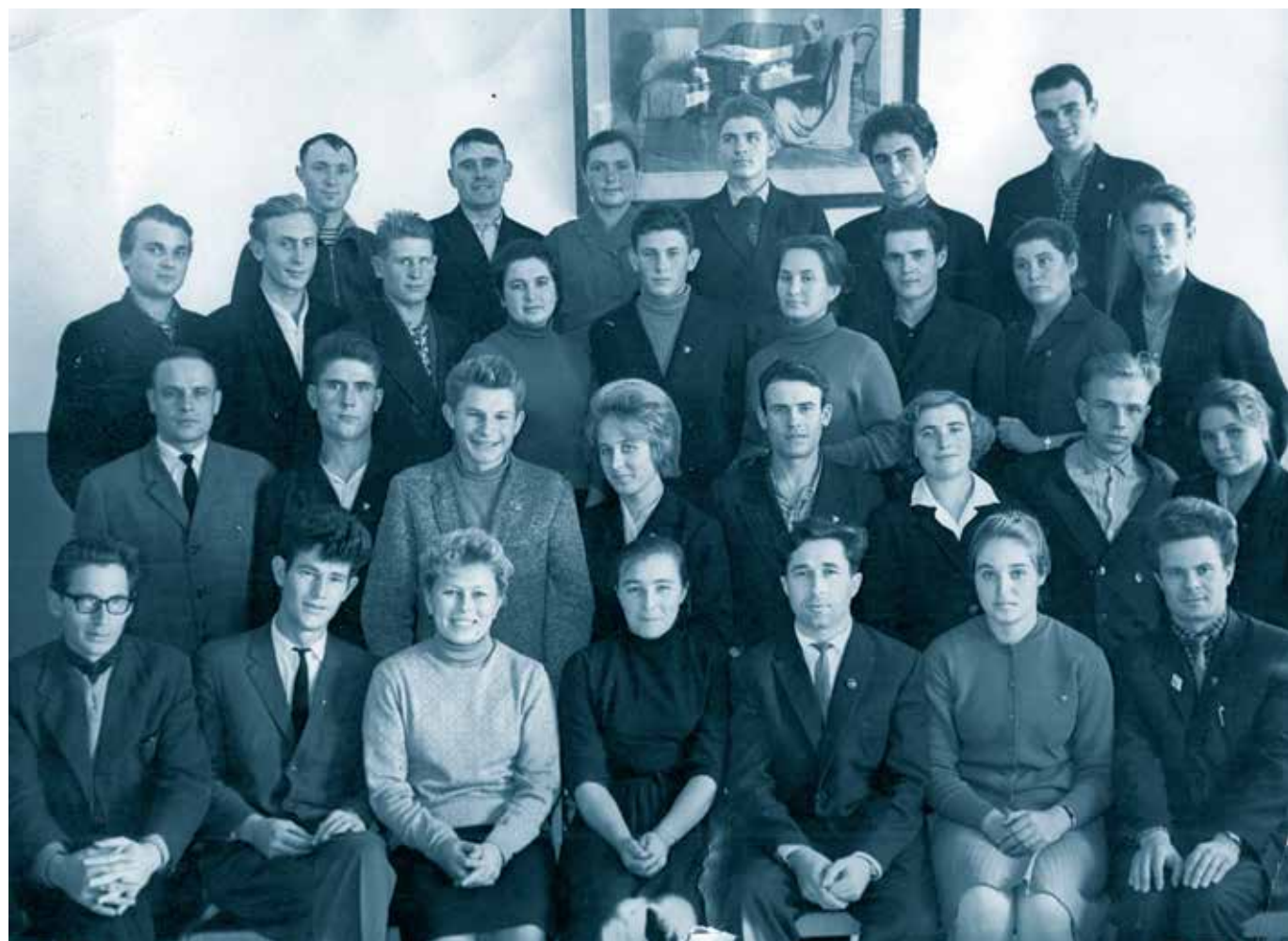
Семинар с секретарями комсомольских организаций в Мордовском ОК ВЛКСМ. 1960-е гг.