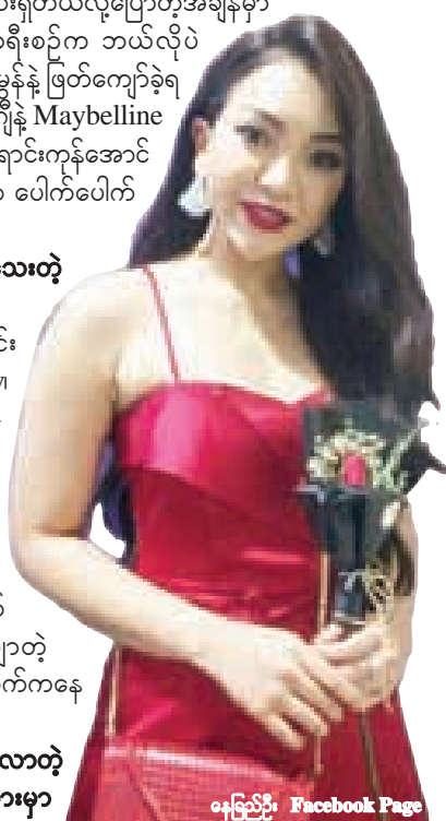
နေခြည် Facebook Page

NCO: အဓိက နေခြည်ကိုပျော်အောင်လုပ်ပေးတဲ့သူက နေခြည်ရဲ့ မေမေပါ။ နေခြည်က မွေးနေ့တုန်းက ခရီးအရမ်း သွားချင်ခဲ့တယ်။ ဒါပေမဲ့ ကိုယ်က ဂျပန်မှာ ဂျီဂျီနဲ့တွေ့ရမယ်ဆိုတော့ ရန်ကုန်မှာလုပ်မယ့် မွေးနေ့ပါတီလေးကို နေခြည် ဖျက်လိုက်ရတယ်။ အဲ့ဒါကြောင့် ဘာလီကို မိသားစုလိုက်သွားဖို့ပေါ့နော်။ ဒါပေမဲ့ နေခြည် ပြန်လာတော့ မေမေကမိသားစု စီးပွားရေးတွေနဲ့ အလုပ်ရှုပ်နေတာကြောင့် ကိုယ့်ဘာသာကိုယ်ပဲ သွားလိုက်တော့ဆိုတာနဲ့ နေခြည်က ဘာလီကို တစ်ယောက်တည်းသွားလိုက်တာပါ။ အဓိက ဘာလီခရီးစဉ်က မေမေကြောင့် နေခြည် အရမ်းပျော်ခဲ့ရတာပေါ့နော်။