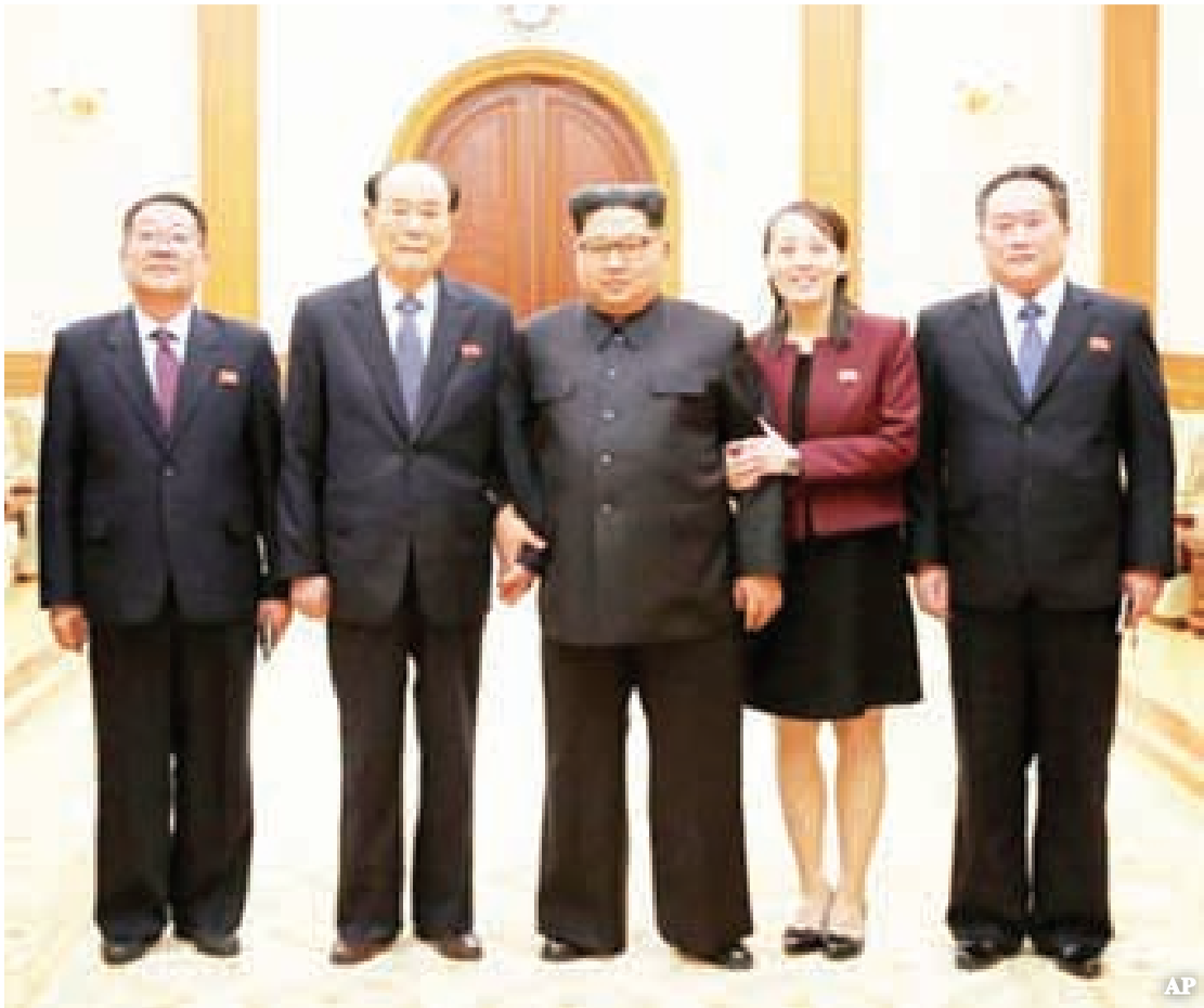
ဆောင်းရာသီအိုလံပစ်ပွဲတော်သို့တက်ရောက်သည့် ကိုယ်စားလှယ်အဖွဲ့ကို ဦးဆောင်ခဲ့သော နမူနာကပ်ကပ် ယင်းအဖွဲ့တွင်လိုက်ပါသွားခဲ့သည့် အဆင့်မြင့်အရာရှိ ကင်ယောင်နင်တို့နှင့် လက်ချင်းချိတ်ကာဓာတ်ပုံရိုက်ကူးနေသည့် ကင်ဂျုံအန်း