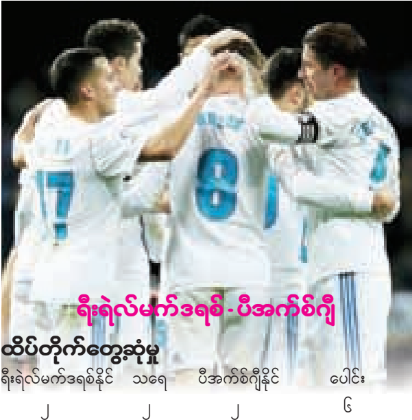
ရီးရဲလ်မက်ဒရစ် - ပီအက်စ်ဂျီ ထိပ်တိုက်တွေ့ဆုံမှု ရီးရဲလ်မက်ဒရစ်နိုင် သရေ ပီအက်စ်ဂျီနိုင် ပေါင်း ၂ ၂ ၂ ၆

နေ့ညမှာတော့ ပရိသတ်ကြိုက် ပွဲကောင်းတစ်ပွဲက ဘောလုံးရသအပြည့်အဝပေးဖို့အတွက် အသင့်ရှိလို့နေပါတယ်။ အဲ့ဒီပွဲစဉ်ကတော့ ချန်ပီယံလိဂ် ၂ နှစ်ဆက် ချန်ပီယံ ရီးရဲလ်မက်ဒရစ်နဲ့ ဒီနစ်မှာ ငွေကြေးအကုန်အကျခံပြီး နေမာနဲ့ အမ်ဘတ်ပေတို့လို ကစားသမားတွေကို ခေါ်ယူအင်အားဖြည့်တင်းထားတဲ့ ပီအက်စ်ဂျီတို့ ထိပ်တိုက်တွေ့နေတဲ့ပွဲစဉ်ပါပဲ။ လက်ရှိမှာ ရီးရဲလ်မက်ဒရစ်က ခြေအတက်အကျ မမှန်သလို နည်းပြဇီဒန်းရဲအနာဂတ်ကလည်း လှုပ်ခတ်လို့နေပါတယ်။ ပီအက်စ်ဂျီကိုသာ နှစ်ကျော့ပေါင်းရလဒ်နဲ့ အရေးနိမ့်ပြီး ရီးရဲလ်မက်ဒရစ်သာ ပြိုင်ပွဲကထွက်လိုက်ရမယ်ဆိုရင် နည်းပြဇီဒန်းနဲ့ ရီးရဲလ်မက်ဒရစ်အကြား လမ်းခွဲခြင်းနိမိတ်ပုံတစ်ခု ကျိန်းသေဆိုက်ရောက်လာတော့မှာပါ။ လီဗာပူးကလည်း သူ့ရဲတိုက်စစ်အစွမ်းကို ပေါ်တိုရဲ့အိမ်ကွင်းမှာ ဘယ်လောက်အတိုင်းအတာ ထုတ်ဖော်ပြသနိုင်လေမလဲဆိုတာက စိတ်ဝင်စားစရာပါပဲ။