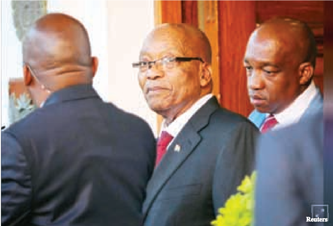
ရာထူးမှ နုတ်ထွက်ရန် ၄၈ နာရီ အချိန်ပေးသည့် အကြောင်းကြားစာကိုပေးရန် ရမ်ဖိုဆာက ဇူးမားထံသွားရောက် တွေ့ဆုံလျက်ရှိသည်