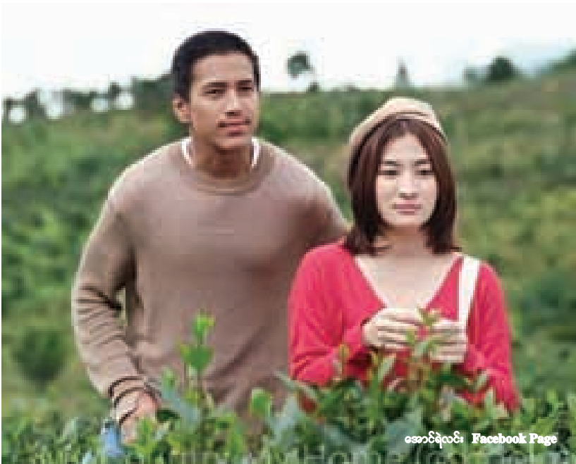
အောင်ရဲလင်း Facebook Page