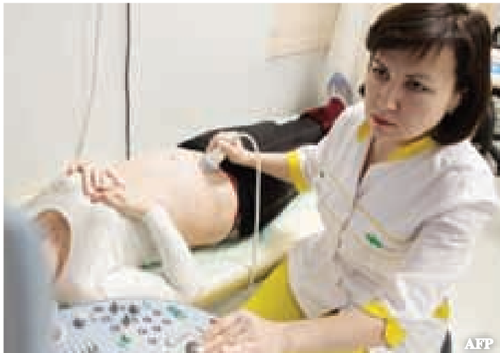
အချို့အလုပ်သမားသည် အငှားကိုယ်ဝန်ဆောင်များကို ဆိုးဝါးစွာဆက်ဆံကြပြီး စည်းကမ်းများကို မလိုက်နာပါက အကြေးငွေပေးရန် ငြင်းဆန်ကြသည်