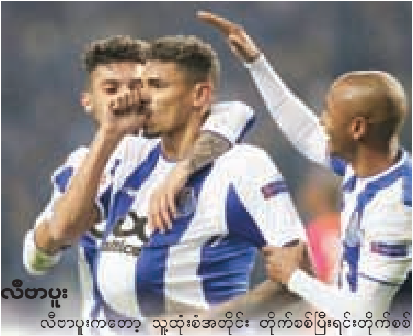
လီဗာပူး လီဗာပူးကတော့ သူ့ထုံးစံအတိုင်း တိုက်စစ်ပြီးရင်းတိုက်စစ်ကစားတဲ့ဟန်မျိုးနဲ့ပဲ ပွဲထွက်လာပါလိမ့်မယ်။ ဆာလားဟ်၊ မာနေနဲ့ ဖာမင်ညီတို့ရဲ့ဟန်ချက်ညီမှုတွေဟာ ပေါ်တိုခံစစ်မှူးတွေကို ကျိန်းသေအလုပ်ရှုပ်စေမှာပါ။ ဒါပေမဲ့ လီဗာပူးရဲခံစစ်စွမ်းဆောင်ရည်က အခုချိန်ထိ စိတ်မချရသေးပါဘူး။ ဗန်ဒစ်ဂျီကို ခေါ်ယူရရှိလိုက်ပြီးတဲ့နောက်မှာ လီဗာပူးခံစစ် အနည်းငယ် ငြိမ်သွားပေမယ့် အမှားကျူးလွန်တတ်မှုတွေကတော့ အမြစ်ပြတ် မသွားသေးပါဘူး။ ချန်ပီယံလိဂ်အုပ်စုအဆင့် အဝေးကွင်းပွဲစဉ်သုံးပွဲကို ဖြတ်သန်းခဲ့ရာမှာလည်း မာရီဘောကို ခုနစ်ဂိုး ဂိုးမရှိနဲ့ နိုင်ခဲ့တဲ့ပွဲကလွဲလို့ ကျန်နှစ်ပွဲမှာ သရေရလဒ်တွေနဲ့သာ လီဗာပူးက ကြုံဆုံရင်ဆိုင်ခဲ့ရပါတယ်။ လီဗာပူးဟာ ပေါ်တူဂီမြေဆီကိုလာရောက်ပြီး ပေါ်တူဂီကလပ်အသင်းတွေနဲ့ ဥရောပပွဲစဉ်ပေါင်း ကိုးပွဲယှဉ်ပြိုင်ခဲ့ရာမှာ နှစ်ပွဲသာ အနိုင်ရခဲ့ပြီး သုံးပွဲသရေကျကာ လေးပွဲရှုံးနိမ့်ထားပါတယ်။ ထူးခြားချက်ရယ်လို့ပြောရမှာက သုံးပွဲသရေ၊ လေးပွဲရှုံးဆိုတဲ့ရလဒ်ကို နောက်ဆုံးယှဉ်ပြိုင်ကစားထားတဲ့ ခုနစ်ပွဲမှာ လီဗာပူး ကြုံခဲ့ရတာပါပဲ။

ပေါ်တိုက ပေါ်တူဂီပြည်တွင်းပွဲစဉ်တွေကို အမှားအယွင်းကင်းကင်းနဲ့ ဖြတ်သန်းနေနိုင်ခဲ့ပါပဲ။ ချန်ပီယံလိဂ် အုပ်စုအဆင့်ဖြတ်သန်းခဲ့မှုကို ကြည့်လိုက်ရင်တော့ ပေါ်တိုက အိမ်ကွင်းမှာ နှစ်ပွဲနိုင်ပြီး တစ်ပွဲရှုံးနိမ့်ခဲ့တာကို တွေ့ရပါတယ်။ အဘူဘာကာ၊ မာရီဂါနဲ့ ဘရာဟီမီစတဲ့ ဂိုးသွင်းအားကောင်းတဲ့ တိုက်စစ်မှူးတွေကို ပိုင်ဆိုင်ထားတာက ပေါ်တိုရဲ့အားသာချက်ပါပဲ။ ဖီလစ်ပီ၊ ဂျီယက်စ်၊ ပီရိုင်းရာ၊ အဲလက်စ်တယ်လ်လက်စ်နဲ့ မာကာနိုတို့ ဦးဆောင်လာမယ့် ပေါ်တိုခံစစ်ဟာ လီဗာပူးတိုက်စစ်ကို ထိန်းချုပ်သွားနိုင်မလားဆိုတာက ဒီပွဲရဲ့အဖြေဖြစ်လာနိုင်ပါတယ်။ ပေါ်တိုရဲ့ဥရောပအဆင့် အိမ်ကွင်းစွမ်းဆောင်ရည်ဟာ အနှစ်ချုပ်ကြည့်လိုက်ရင် သိပ်အကောင်းကြီးတော့ မဟုတ်ပါဘူး။ နောက်ဆုံးယှဉ်ပြိုင်ကစားထားတဲ့ ဥရောပအဆင့် အိမ်ကွင်းပွဲစဉ် ၁၀ ပွဲမှာ ပေါ်တိုအနိုင်ရခဲ့တာက လေးပွဲတည်းသာ ရှိထားပါတယ်။ ၂၀၀၃-၀၄ ဘောလုံးရာသီတုန်းက နည်းပြမော်ရင်ညိုရဲ့ဦးဆောင်မှုနဲ့ ချန်ပီယံလိဂ် ၁၆ သင်းအဆင့်မှာ မန်ယူကို နှစ်ကျော့ပေါင်းရလဒ်နဲ့နိုင်ခဲ့ပြီးတဲ့နောက်ပိုင်းမှာ ပေါ်တိုက ဒီအဆင့် ဒီနေရာမှာ အင်္ဂလိပ်အသင်းတွေကို နှစ်ကျော့ပေါင်းရလဒ်နဲ့ အနိုင်ယူနိုင်တယ်ရယ်လို့ ထပ်မံရှိတော့ပါဘူး။ အင်္ဂလိပ်အသင်းတွေနဲ့ နောက်ဆုံးကစားထားတဲ့ ပွဲစဉ်လေးပွဲမှာဆိုရင်လည်း ပေါ်တိုက နိုင်ပွဲပျောက်ဆုံးမှုနဲ့သာ ရင်ဆိုင်ကြုံဆုံထားရပါတယ်။