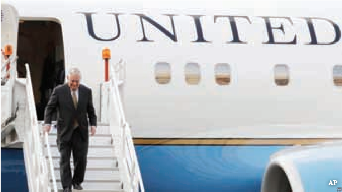
အီဂျစ်နိုင်ငံသို့ တေလာဆန် ရောက်ရှိလာစဉ်

အမေရိကန် ဒုသမ္မတမိုက်ပင့်စ်၏ ကိုင်ရိုခရီးစဉ်တွင် နိုင်ငံခြားရေးဝန်ကြီး တေလာဆန်က အမေရိကန်နှင့် အီဂျစ် အကြား အကြမ်းဖက်ဝါဒ တိုက်ဖျက်ရေး အကျိုးတူ ကတိကဝတ်ပြုမှုကို ခိုင်မာစေရန် ရည်မှန်းထားသည်ဟု VOAသတင်းတွင် ဖော်ပြထားသည်။